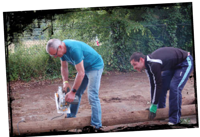
L'entraide pour la taille