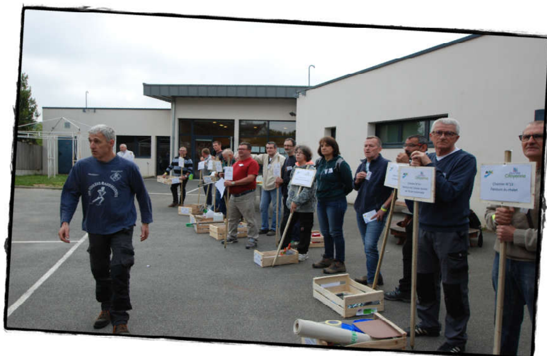
Les divers chantiers