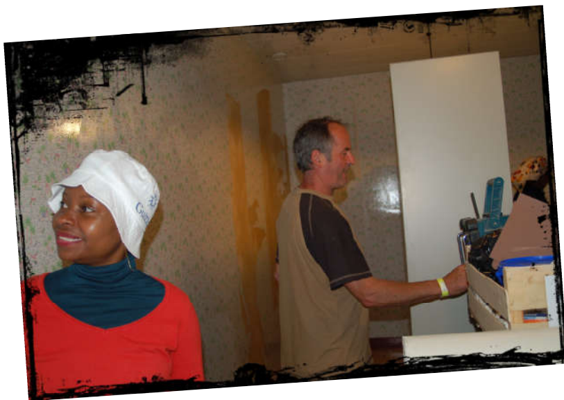
Décollage du papier peint avec le sourire