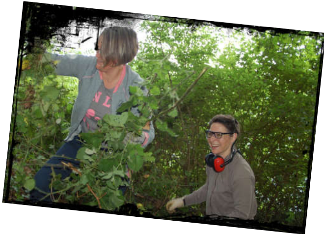
Hé oui, les femmes débroussaillent ! dans la bonne humeur