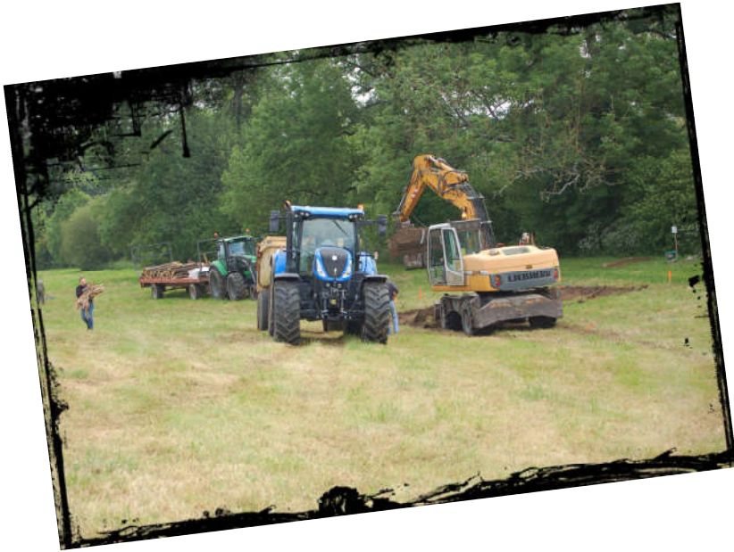
Tracteur et pelleteuse à l'oeuvre