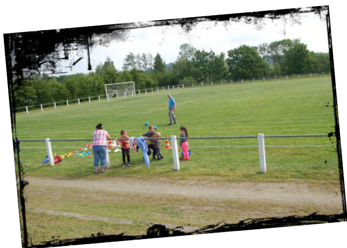
Jeux sur le terrain de foot pour la garderie