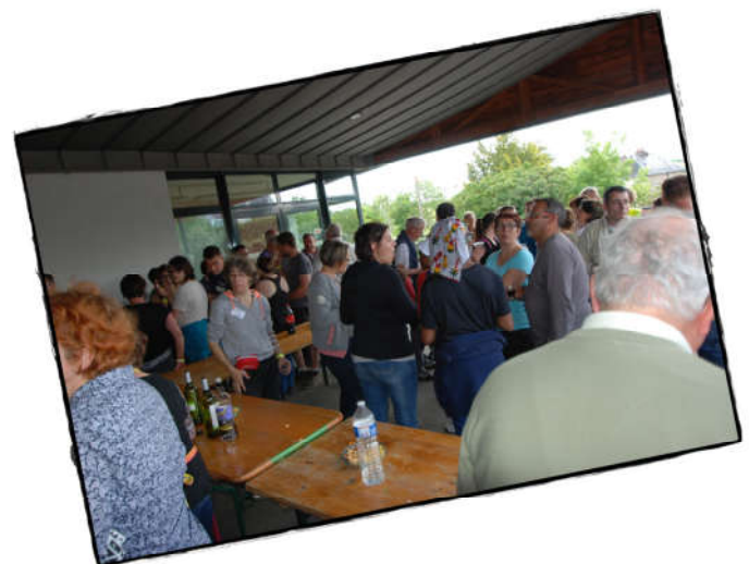
L'apéritif après les premières heures de travail