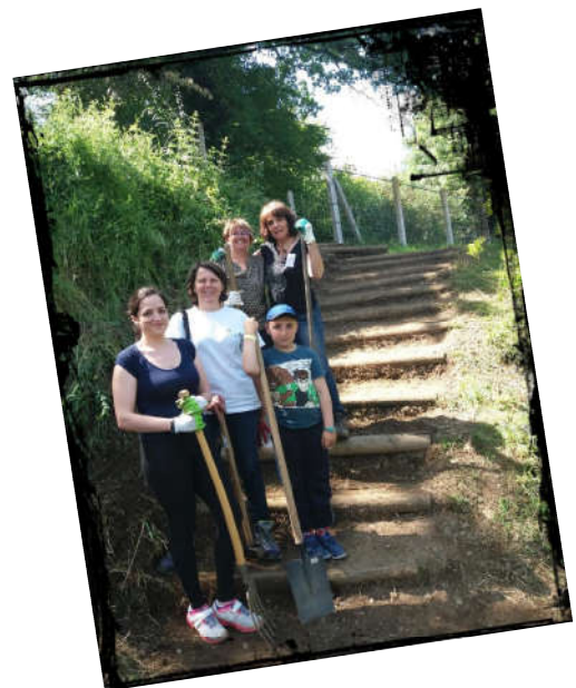
Création de marches sur le talus devant l'entrée du cimetière.