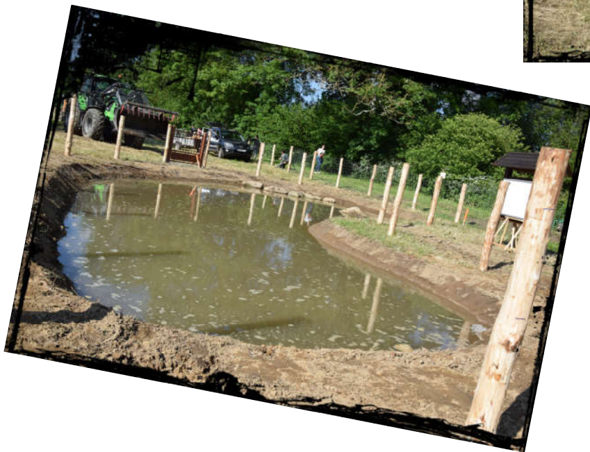
La mise en eau de la mare!