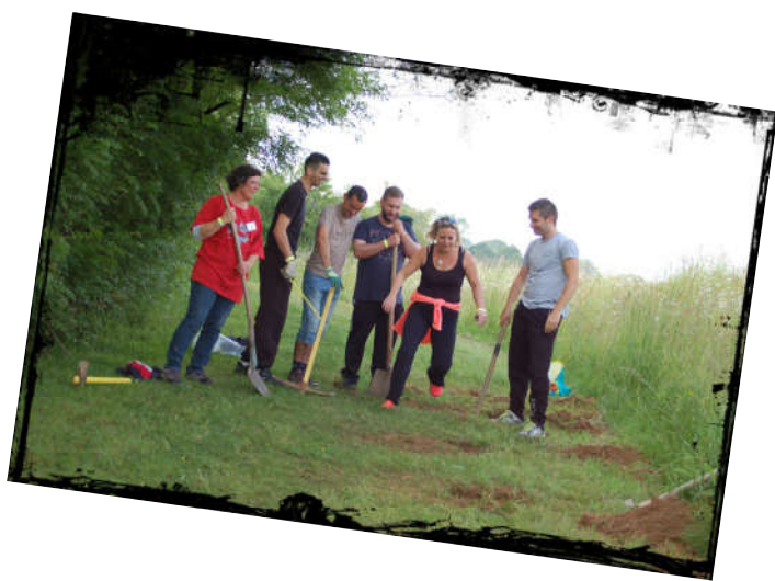
Beaucoup d'énergie pour les trous des agrès