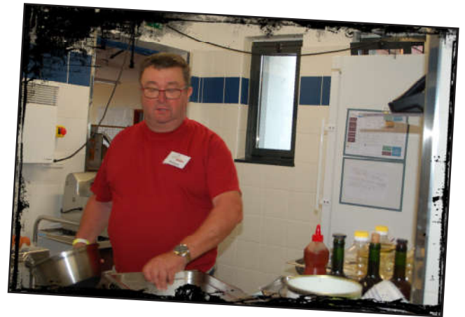
Le repas se prépare en cuisine