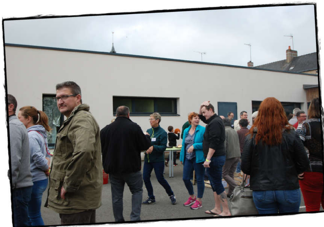
Rencontre des participants Mise en place de la journée