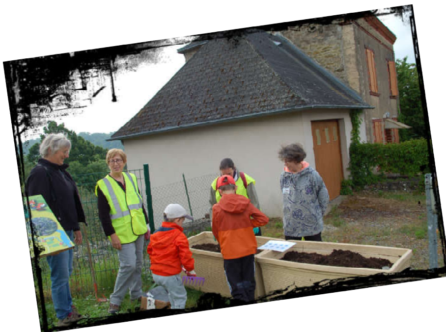
Préparation des bacs

Plantation des herbes aromatiques, installation d'étiquettes réalisées à l'aide d'ardoises brisées