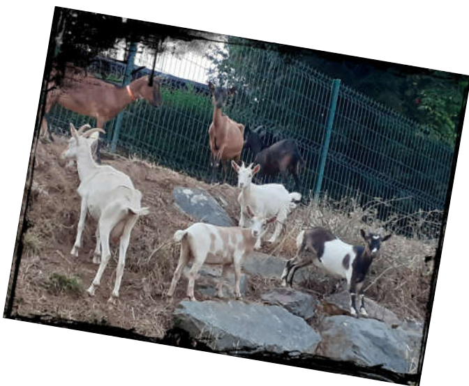
Et maintenant à elles de continuer