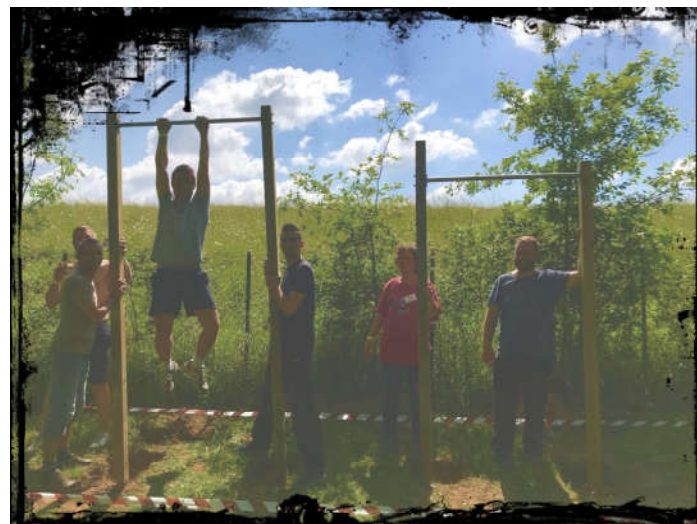
La pose des creuseurs qui s'essayent aux agrès