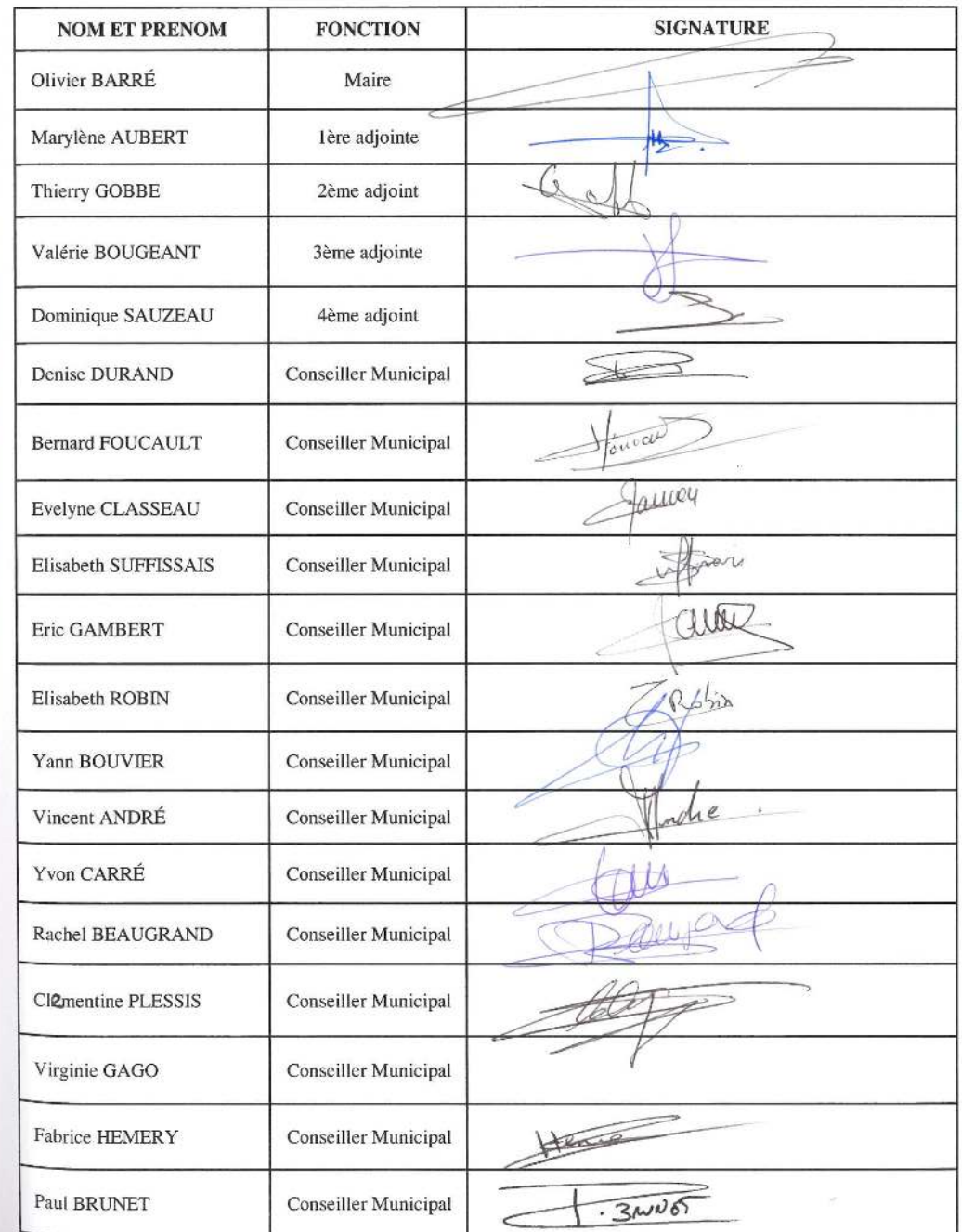
TABLEAU DE PRESENCE