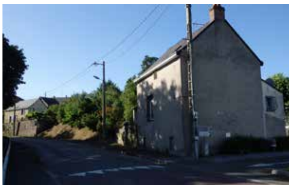
Maison 12,rue de la mairie