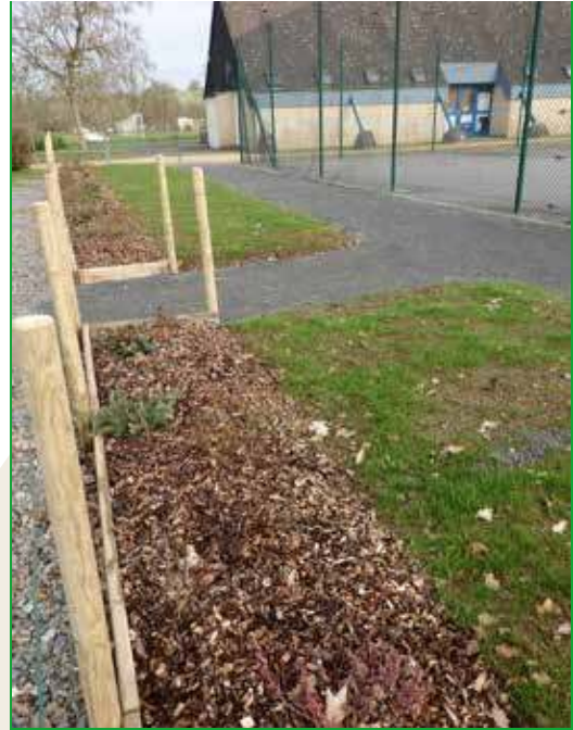
Plantations et cheminement