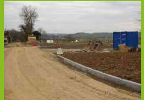
Les Grandes Mées