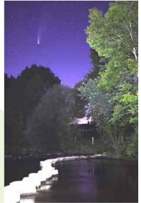
Photo prise le 21 juillet 2020 à 23h52 COMÈTE NÉOWISE À QUIFEU - Saint Jean sur Mayenne »

ASSOCIATION : « A la rencontre du passé de Saint Jean Sur Mayenne »