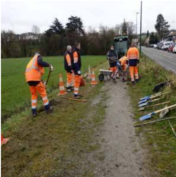
Cheminement rue Saint Trèche

La préparation pour poser une lisse le long du cheminement est en cours.