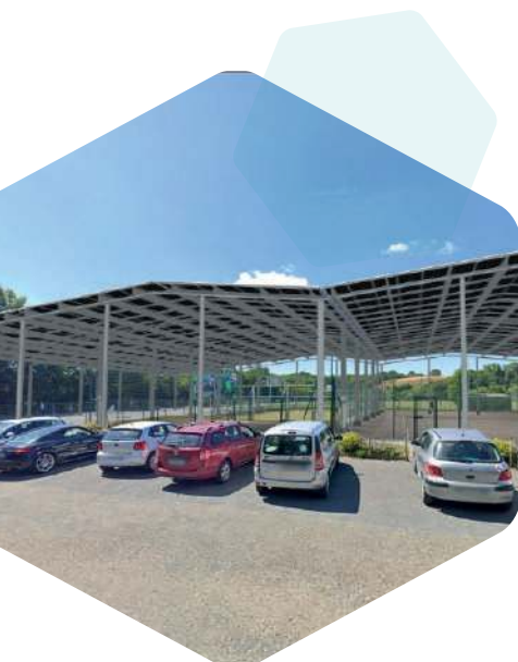
Projet de l'ombrière

Développer des centrales solaires en Mayenne, c'est aussi faire travailler des entreprises locales et créer des emplois, ainsi qu'apporter des recettes supplémentaires aux communes qui accueilleront les installations. Mener ces projets selon la logique de l'énergie citoyenne, c'est aussi participer à tisser le lien social localement, en réunissant citoyens et acteurs du territoire autour de projets communs, concrets, qui bénéficieront à tous.